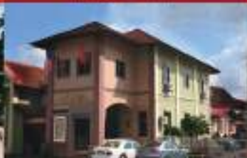
BALAI SENI LUKIS KELANTAN KELANTAN ART GALLERY