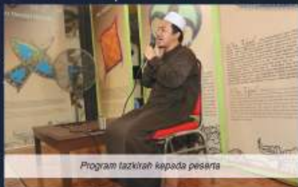
Program tazkirah kepada peserta

Berdasarkan sambutan menggalakkan yang diterima terhadap penganjuran program ini saban tahun, muzium negara buat julung kalinya telah berjaya melaksanakan 'Program Perdana Bermalam di Muzium' secara serentak pada tahun 2018 yang melibatkan 22 buah muzium dibawah pentadbirannya sehingga berjaya