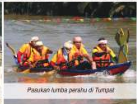
Pasukan lumba perahu di Tumpat