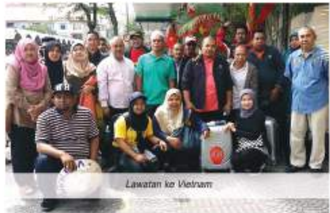
Lawatan ke Vietnam

Kelab Cindai juga telah dijemput menyertai pertandingan Lumba Perahu Panjang di Pantai NDO Tumpat Kelantan. Sebagai kerja amal, ahli kelab juga telah mengadakan gotong-royong membersihkan Makam Raja Abdullah di Padang Halban Melor Kota Bharu.