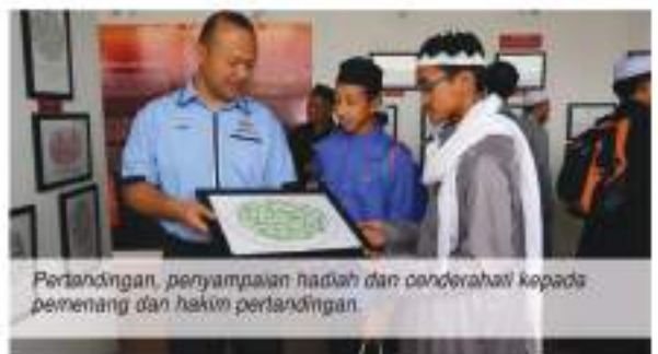
Pertandingan, penyampaian hadiah dan cenderahai kepada pemenang dan hakim pertandingan.