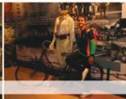
Antara pengisian Pameran Kemerdekaan