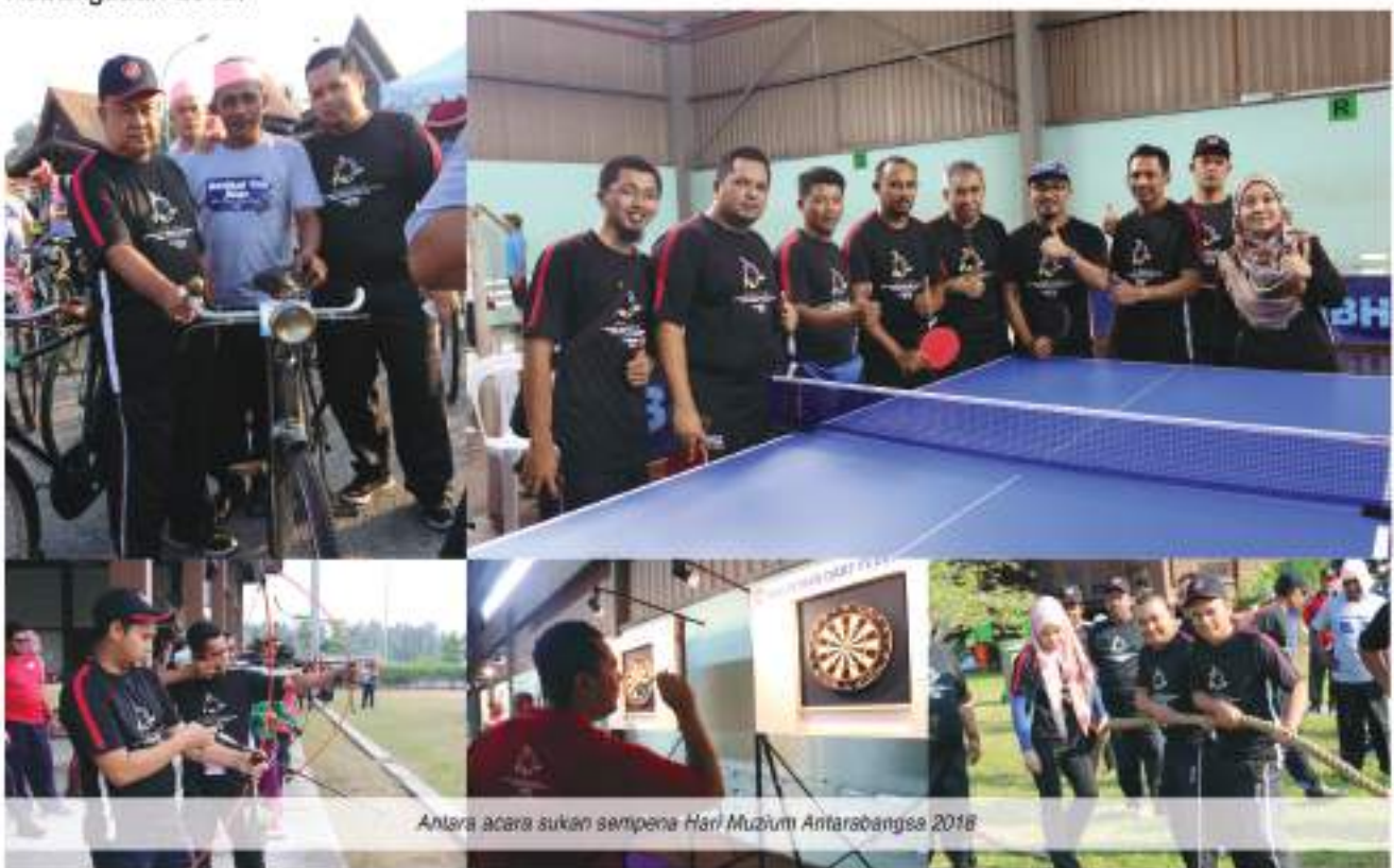
Antara acara sukan sempena Hari Muzium Antarabangsa 2018

Pelbagai program melibatkan bukan sahaja warga Muzium, malah masyarakat setempat sepanjang sambutan ini seperti Pameran Hari Muzium Antarabangsa di Perkarangan Memorial Pengisytiharan Kemerdekaan Banda Hilir, seminar Hari Muzium Antarabangsa di Auditorium Seri Negeri Air Keroh, kejohanan sukan hari Muzium Antarabangsa di Komplek Sukan Batu Berendam, program bersama komuniti di Hang Tuah Centre, Duyung, Museum Run 2018 dan Treasure Hunt Melaka Bandaraya Warisan Dunia. Acara kemuncak adalah Perasmian yang juga pelancaran Hari Muzium Antarabangsa sebaga tanda sokongan muzium-muzium kepada sambutan Hari Muzium Antarabangsa Peringkat Kebangsaan dengan tema "Jaringan Muzium: Pendekatan terkini, sasaran Baru" ( Hyperconnected Museums: New Approached, New Publics ) Majlis Perasmian telah disempurnakan oleh YB. Datuk Mohammadin bin Ketapi, Menteri Pelancongan Seni dan Budaya Malaysia di Perkarangan Memorial Pengisytiharan Kemerdekaan Banda Hilir. Pada Majlis penutup Hari Muzium Antarabangsa ini telah berlansung Majlis Penyerahan bendera kontijen kepada Muzium Sabah yang secara rasminya Negeri Sabah akan menjadi tuan rumah sambutan Hari Muzium Antarabangsa Peringkat Kebangsaan 2019.