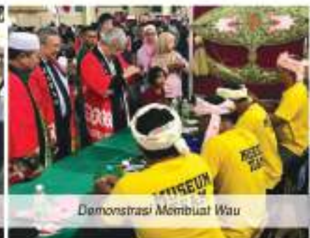
Demonstrasi Membuat Wau