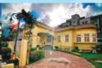
MUZIUM DIRAJA (ISTANA BATE) THE ROYAL MUSEUM