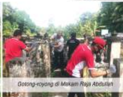
Gotong-royong di Makam Raja Abdullah