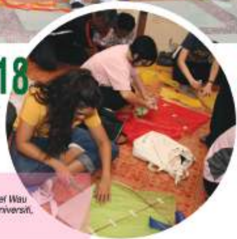
Peserta bengkel Wau dari Sunway Universiti, Selangor

Sepanjang tahun 2018 pelbagai aktiviti bengkel telah dirancang dan dilaksanakan bersesuaian dengan Muzium sebagai pusat penyebaran ilmu pengetahuan. Antaranya ialah bengkel membuat wau tradisional di Muzium Wau, Pantai Sri Tujoh, Tumpat. Bengkel batik cantting di Muzium Kraftangan dan bengkel lukisan di Balai Seni Lukis Kelantan. Peserta-peserta bengkel terdiri daripada pelajar-pelajar sekolah sekitar Jajahan Kota Bharu, Tumpat dan Pasir Mas serta pelajar daripada Kolej dan Universiti. Objektif bengkel ini diadakan ialah untuk memberi peluang kepada pelajar atau generasi baru bagaimana cara membuat wau tradisional, batik cantting dan teknik-teknik melukis.