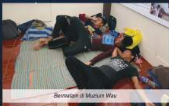
Bermalam di Muzium Wau