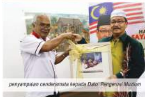
penyampalan cenderamata kepada Dato' Pengerusi Muzium