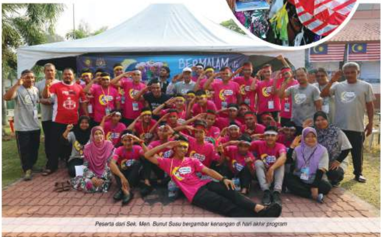
Peserta dari Sek. Men. Bukit Susu bergambar kenangan di hari akhir program