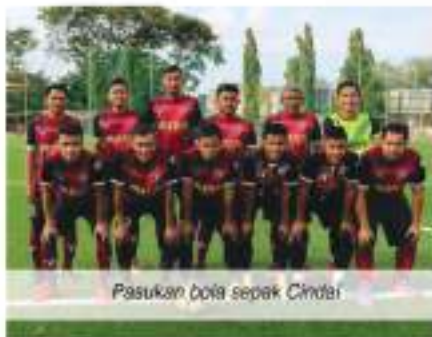
Pasukan bola sepak Cindai