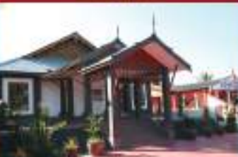
MUZIUM KUALA KEPAI ELUAKA KEPAI MUSEUM