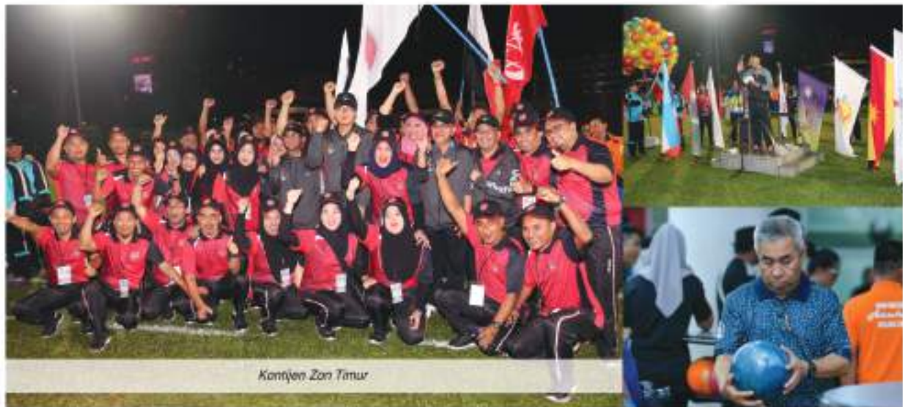
Kontijen Zon Timur

Pelbagai program melibatkan bukan sahaja warga Muzium, malah masyarakat setempat sepanjang sambutan ini seperti Pameran Hari Muzium Antarabangsa di Perkarangan Memorial Pengisytiharan Kemerdekaan Banda Hilir, seminar Hari Muzium Antarabangsa di Auditorium Seri Negeri Air Keroh, kejohanan sukan hari Muzium Antarabangsa di Komplek Sukan Batu Berendam, program bersama komuniti di Hang Tuah Centre, Duyung, Museum Run 2018 dan Treasure Hunt Melaka Bandaraya Warisan Dunia. Acara kemuncak adalah Perasmian yang juga pelancaran Hari Muzium Antarabangsa sebaga tanda sokongan muzium-muzium kepada sambutan Hari Muzium Antarabangsa Peringkat Kebangsaan dengan tema "Jaringan Muzium: Pendekatan terkini, sasaran Baru" ( Hyperconnected Museums: New Approached, New Publics ) Majlis Perasmian telah disempurnakan oleh YB. Datuk Mohammadin bin Ketapi, Menteri Pelancongan Seni dan Budaya Malaysia di Perkarangan Memorial Pengisytiharan Kemerdekaan Banda Hilir. Pada Majlis penutup Hari Muzium Antarabangsa ini telah berlansung Majlis Penyerahan bendera kontijen kepada Muzium Sabah yang secara rasminya Negeri Sabah akan menjadi tuan rumah sambutan Hari Muzium Antarabangsa Peringkat Kebangsaan 2019.