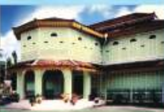
MUZIUM ISLAM ISLAMIC MUSEUM