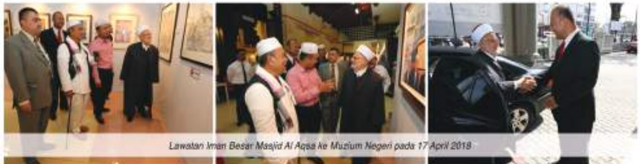
Lawatan Imam Besar Masjid Al Aqsa ke Muzium Negeri pada 17 April 2018

Lahir pada tahun 1949 di Kubang Kerian Kota Bharu. Mula bergiat sebagai pelukis pada tahun 2006. Beliau merupakan ahli kepada Persatuan Seni Lukis Kelantan (PESENI), Gabungan Pelukis SeMalaysia (GAPs) dan Ahli @ Membership Balai Seni Visual Negara (BSVN). Karya-karya beliau banyak memaparkan tema kemasyarakatan dan budaya setempat menggunakan Media Cat air, akrilik dan Cat Minyak. Beliau banyak menerima jemputan pameran Solo Lukisan di merata tempat Malaysia.