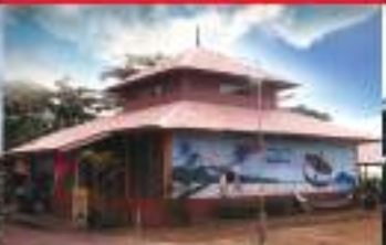
MUZIUM WAJIB WAQF MUSEUM