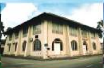
MUZIUM PERANG (BANK KERAPI) WAQF MUSEUM