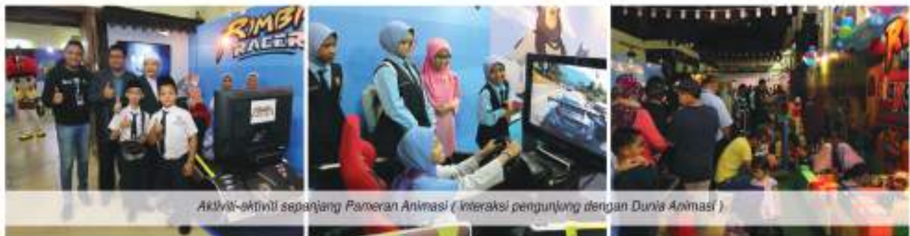
Aktiviti-aktiviti sepanjang Pameran Animasi ( Interaksi pengunjung dengan Dunia Animasi )

Pameran Animasi ini menampilkan 30 maskot-maskot Animasi daripada Pavilion Planet Sdn. Bhd. yang mengendalikan persembahan sepanjang pameran ini. Pameran yang berlangsung selama dua bulan ini telah dikunjungi oleh puluhan ribu pelawat dari dalam dan luar Kelantan.