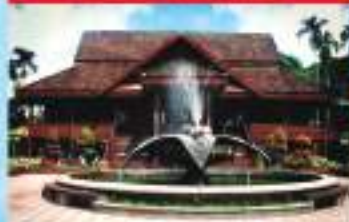
MUZIUM KRAFTANGAN HANDICRAFT MUSEUM