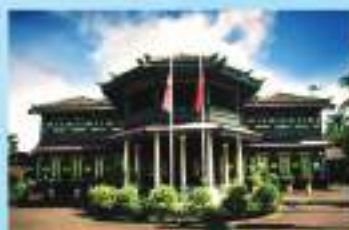
MUZIUM ADAT ISTADAT DI RAJA KELANTAN ROYAL CEREMONIES MUSEUM

MUSEUMS UNDER KELANTAN STATE MUSEUM CORPORATION