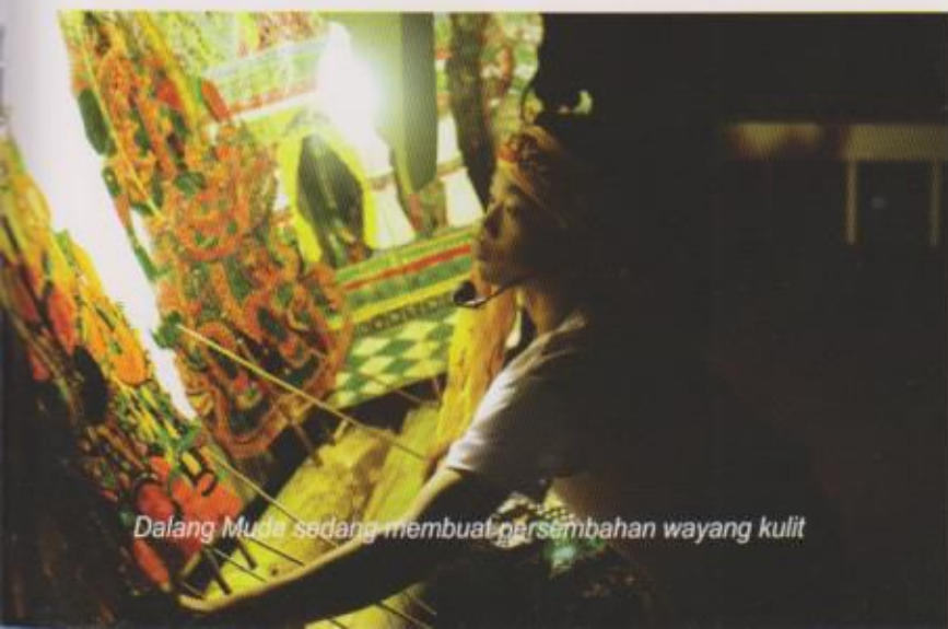
Dalang Muda sedang membuat persembahan wayang kulit