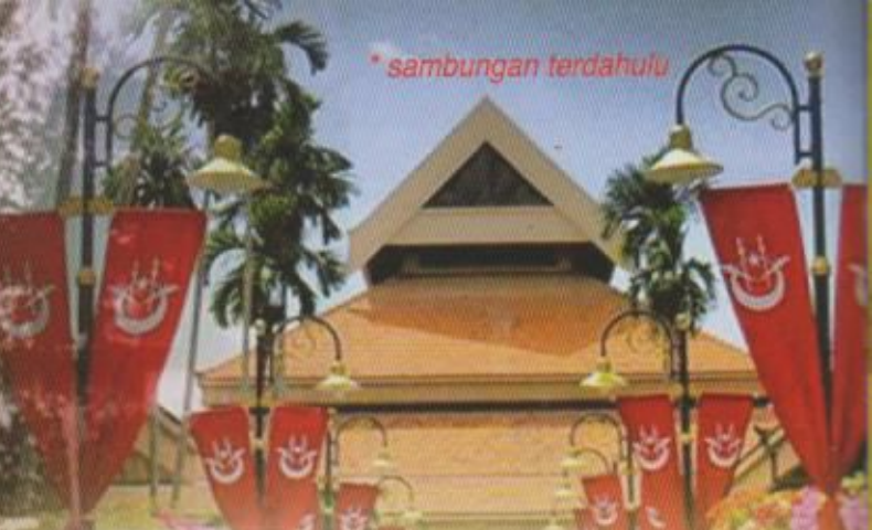
Pejabat SUK Kota Darulnaim sekarang