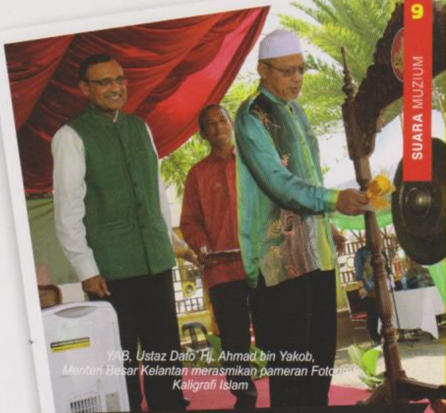
YAB, Ustaz Dato' Haji Ahmad bin Yakob, Menteri Besar Kelantan merasmikan pameran Fotografi Kaligrafi Islam

Pameran ini merupakan kerjasama antara Perbadanan Muzium Negeri Kelantan dengan Kementerian Kebudayaan India dan Pesuruhjaya Tinggi India ke Malaysia. Sebanyak 40 buah fotografi Kaligrafi islam hasil karya " calligrapher " terkenal dibawa khas dari Perpustakaan Rampur Raza India. Kaligrafi secara umumnya mempunyai maksud seni penulisan yang indah. Penulisan kaligrafi ini berasal dari bahasa Yunani iaitu Kallios Yang bererti indah dan Graphia yang bererti tulisan. Seni ini dicipta dan dikembangkan oleh kaum muslim sejak kewujudan Islam. Sebagai bahasa yang memiliki karakter lembut dan Artistik, huruf Arab adalah amat bersesuaian khususnya ayat-ayat Al-Quran dan Hadith dalam menulis khat. Pameran ini telah diadakan di Muzium Islam dan telah disempurnakan perasmiaannya oleh YAB Ustaz Dato' Haji Ahmad bin Yakob pada 14 Mei 2015.