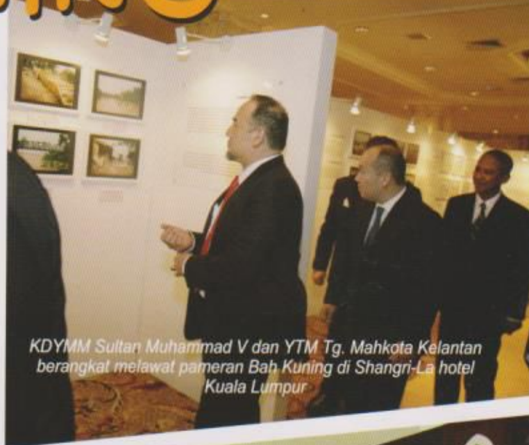
KDYMM Sultan Muhammad V dan YTM Tg. Mahkota Kelantan berangkat melawat pameran Bah Kuning di Shangri-La hotel Kuala Lumpur

Pada 18 hingga 29 Disember 2014, sekali lagi Negeri Kelantan dilanda banjir yang dianggap paling buruk, luar biasa dan diluar jangkaan yang boleh diistilah sebagai tsunami air sungai. Banjir ini dikenali sebagai Bah Kuning. Sebagai usaha untuk mengumpul dan mendokumentasi bahan-bahan mengenai peristiwa banjir di atas, Perbadanan Muzium Negeri Kelantan telah mengambil inisiatif mengadakan satu pameran Bah Kuning bertempat di Muzium Negeri dan diikuti pameran bergerak ke jajahan Kuala Krai, Pasir Putih, Hotel Shangri-La Kuala Lumpur dan berakhir di Stadium Sultan Muhammad ke IV. Pameran ini telah dilancarkan pada 16 Febuari 2015 oleh YB Dato' Mejar ( B ) Hj Md Anizam bin Ab Rahman Pengerusi Kebudayaan, Kesenian dan Warisan negeri kelantan merangkap Pengerusi Perbadanan Muzium Negeri Kelantan.