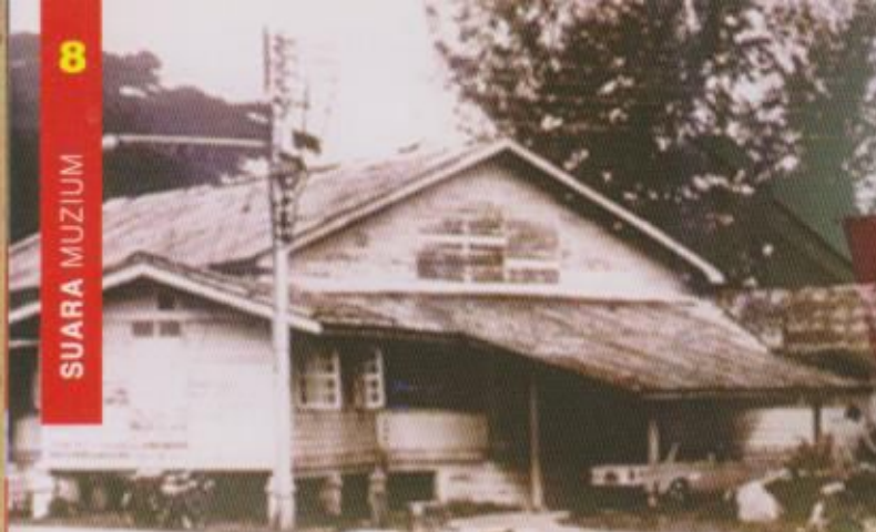
Pejabat Setiausaha Kerajaan (SUK) di Padang Gimlette (Pejabat Mara sekarang) Jalan Hospital, Kota Bharu