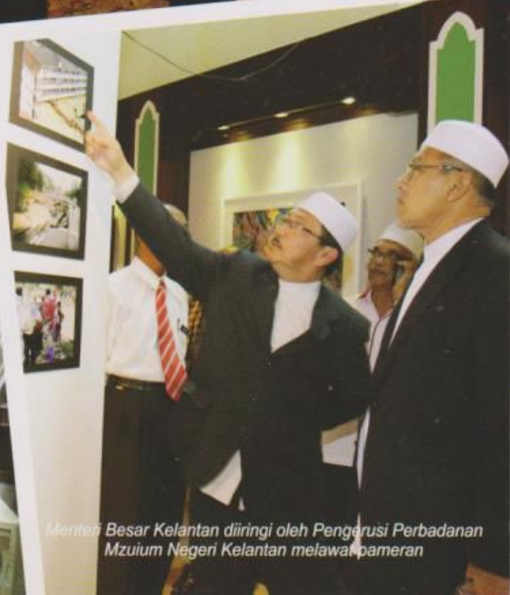
Menteri Besar Kelantan diiringi oleh Pengerusi Perbadanan Muzium Negeri Kelantan melawat pameran