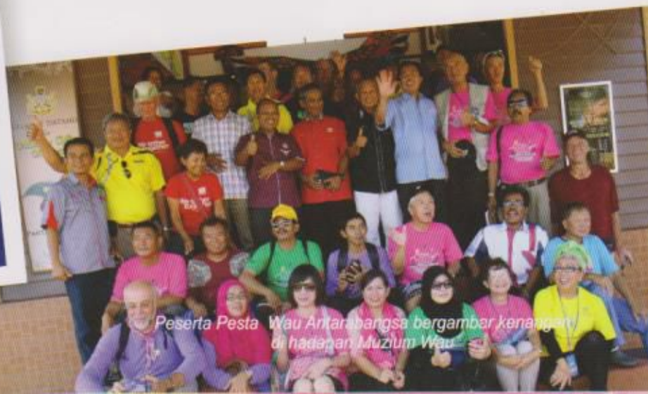
Peserta Pesta Wau Antarabangsa bergambar kenangan di hadapan Muzium Wau