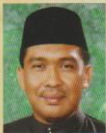
YB. Dato' Hj. Takiyuddin bin Hj. Hassan 2000 - 2013