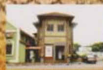
BALAI SENI LUKIS