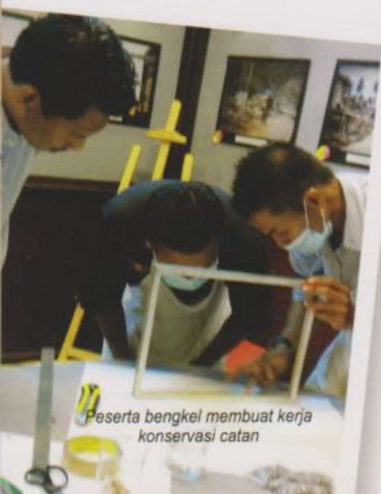
Peserta bengkel membuat kerja konservasi catan

Bagi tujuan pemuliharaan koleksi lukisan, Balai Seni Lukis Kelantan telah mengambil usaha mengadakan bengkel konservasi catan: Handling dan condition report kepada kakitangan muzium selama empat hari bermula 15 Machingga 18 Mac 2015 bertempat di Balai Seni Lukis Kelantan Jalan Sultan Ibrahim Kota Bharu. Bengkel ini pada dasarnya dibahagi kepada dua segmen iaitu ceramah dan amali berkaitan dengan kerja konservasi catan. Ini termasuklah pengenalan jenis media dan kerosakkan serta kaedah pemulihan, lukisan permukaan catan: Backing board dan camy living.