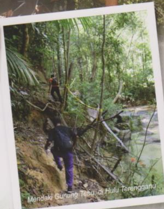
Mendaki Gunung Tebu, di Hulu Terengganu