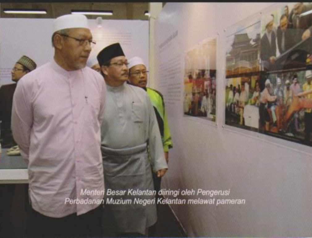
Menteri Besar Kelantan diiringi oleh Pengerusi Perbadanan Muzium Negeri Kelantan melawat pameran