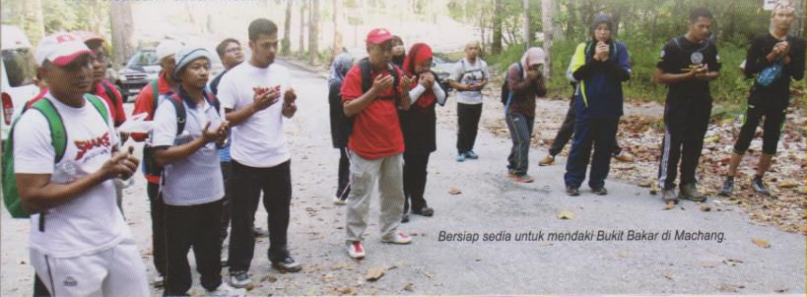
Bersiap sedia untuk mendaki Bukit Bakar di Machang.