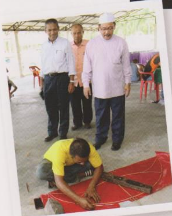
YB. Dato' Pengerusi Muzium melawat bengkel pembuatan wau

Perbadanan Muzium Negeri Kelantan dengan kerjasama Persatuan Pelayang Negeri Kelantan telah berjaya mengadakan bengkel wau tradisi Negeri Kelantan pada 12 hingga 13 Mei 2015 bertempat di Muzium Wau, Pantai Sri Tujoh, Tumpat Kelantan.